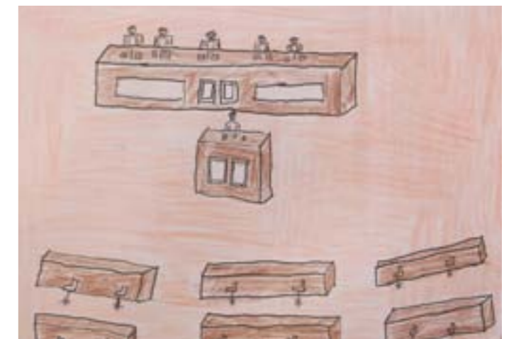
Plenarna sala. U toku je premijerski sat.