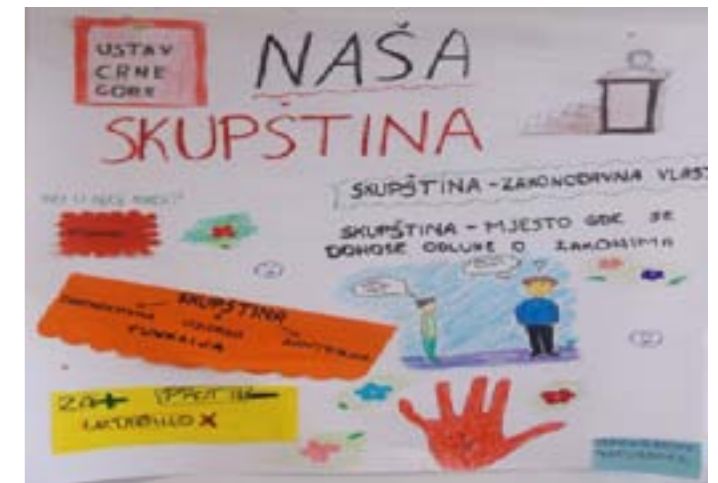
Pano o Skupštini