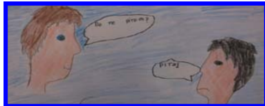
Poslanik koji pita i premijer koji odgovara.