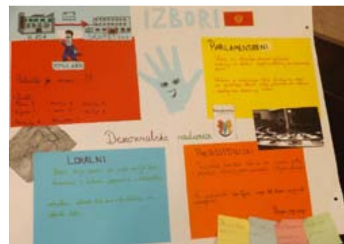
Naš pano o izborima