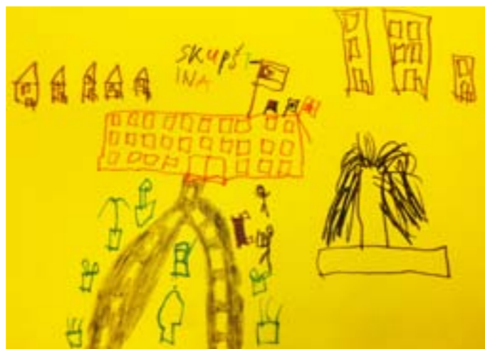
Crtež Radula Obradovića, koji predstavlja skupštinu

Ovi izbori se održavaju svake četvrte godine!