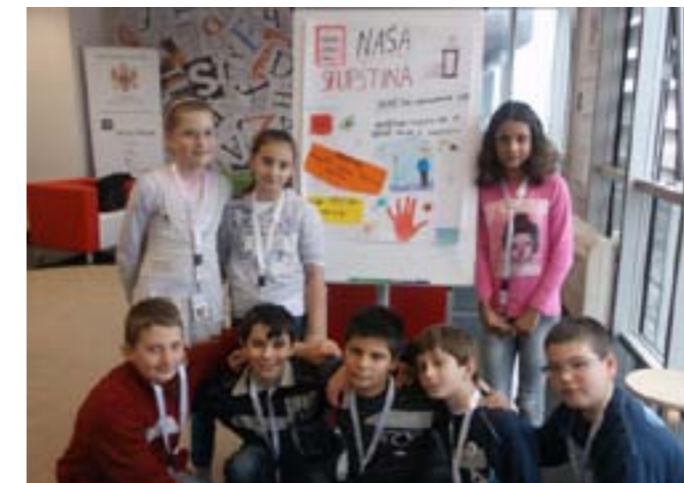
Družina „Crvena ručica“ nakon zadatka!