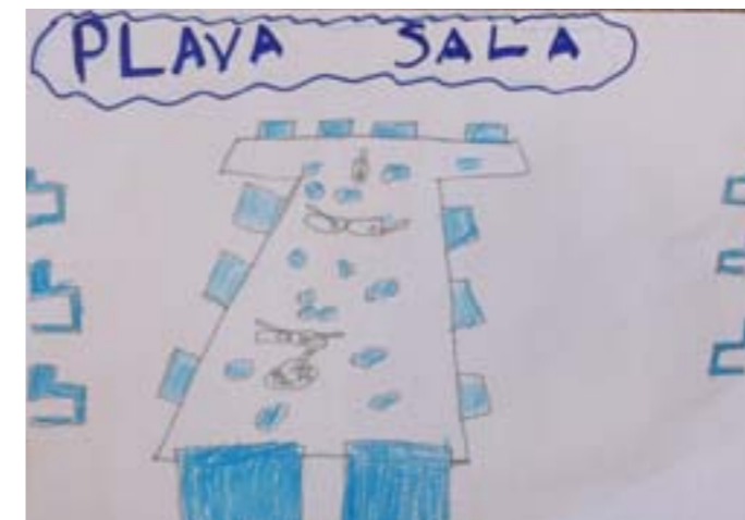
Sala u kojoj se održavaju sjednice odbora.