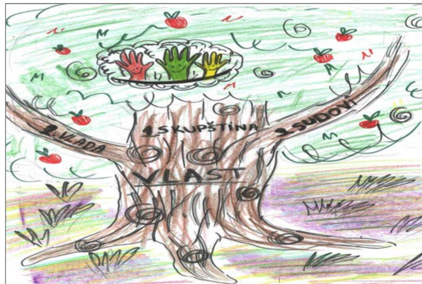
Kao što vidite na našem panou, u demokratiji je vlast podijeljena na tri grane. U Crnoj Gori te tri grane čine Skupština, Vlada i sudovi.