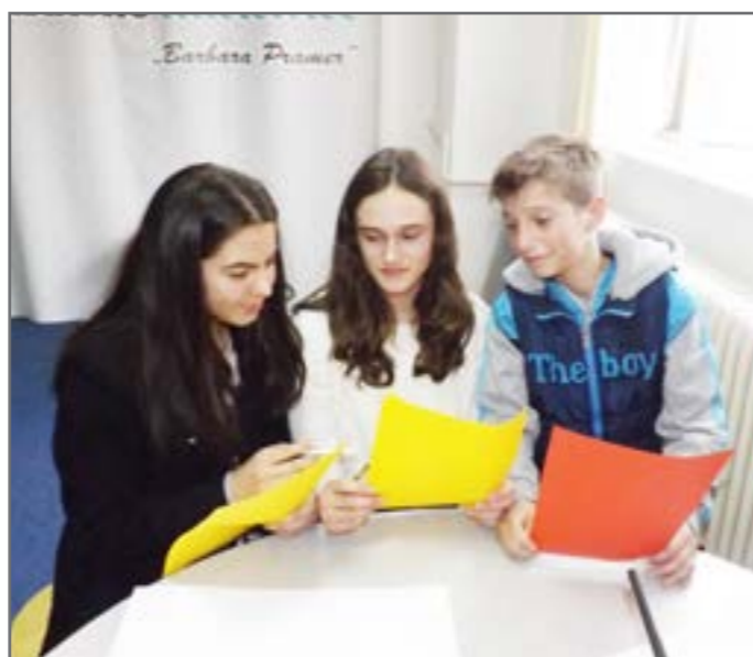
Da bi podjela vlasti funkcionisala, bitno je da se grane vlasti međusobno kontrolišu.

Osnovna škola „Braća Ribar“ nagradila je učenike IX razreda organizacijom drugarske večeri. Zbog dobre saradnje, poštovanja i složnosti naše odjeljenje dobilo je mogućnost organizacije žurke. Da bi žurka bila što uspješnija i bolje funkcionisala učenici su se podijelili u tri grupe. Prvu grupu činili su đaci koji pohađaju muzičku školu, oni su bili zaduženi za organizaciju muzičkog dijela žurke. Druga grupa bila je zadužena da pronađe prostor. Treća grupa je bila zadužena za dekoraciju prostora. Grupe su međusobno razmjenjivale mišljenja, kontrolisale jedna drugu i timski su dobro saradivale. Učenici su sve ideje prihvatili i razmatrali. Sastajali su se veoma često kako bi ishodi bili što bolji i uspješniji. Odgovornost i organizacija bila im je na prvom mjestu. Bili su dobri saradnici i sagovornici. Poštovali su tuđe ideje. Nakon napornog rada učenici su bili veoma zadovoljni ishodom. Jedva su čekali da čuju komentare uprave i svojih drugara.