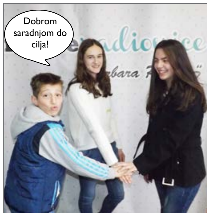
Ali je isto toliko bitno da sve tri grane vlasti saraduju!