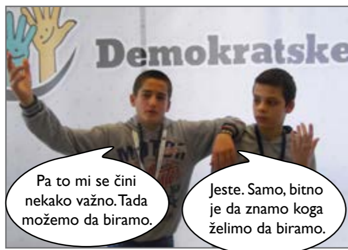
Izbori im se čine važnim.