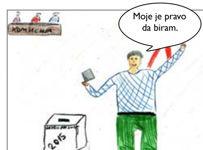
Vojislav i Lazar su crtežom prikazali kako izgleda izborna procedura.