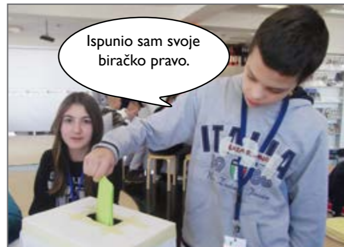
I Lazar je ispunio svoje biračko pravo i glasao.