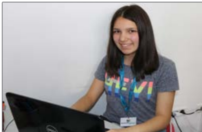
Autorka teksta: Sara

U demokratiji, ljudi treba da budu humani, da pregovaraju i da sarađuju, treba da budu aktivni, da promijene stvari koje misle da su pogrešne.