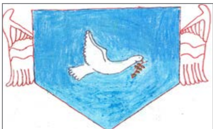
Sloboda krase demokratsko društvo. Građani su slobodni da izraze svoje mišljenje, da se kreću i udružuju. Crtež su nacrtali Lazar i Nemanja.