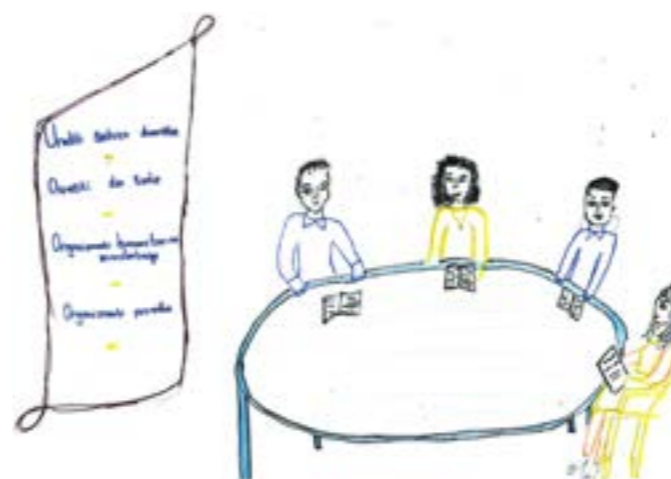
Aktivni građani unapređuju zajednicu i rade na razvoju demokratskog društva. Autorka: Atanasija

Zaključujemo da svi građani treba da budu aktivni, jer zajedno možemo mnogo toga da doprinesemo za razvoj svoje zajednice.