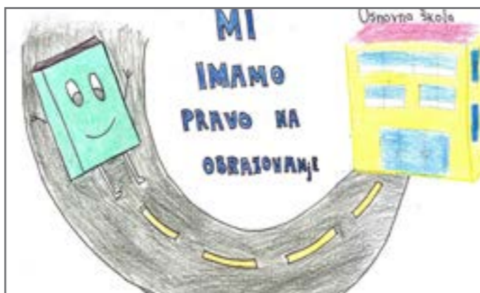
Demokratsko društvo teži tome da se svim građanima omoguće jednaka prava. Jedno od prava koje imamo je pravo na obrazovanje. Crtež je nacrtala Maša.