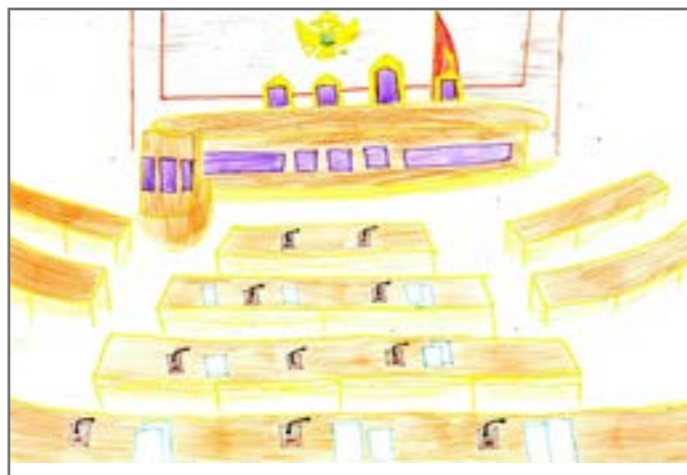
Velika sala je mjesto u kojem poslanici donose zakone. Crtež je nacrtala Adana.

Zakone donose poslanici. U Skupštini radi 81 poslanik. Oni donose, mijenjaju i dopunjuju već postojeće zakone. Crtež je nacrtao Petar.