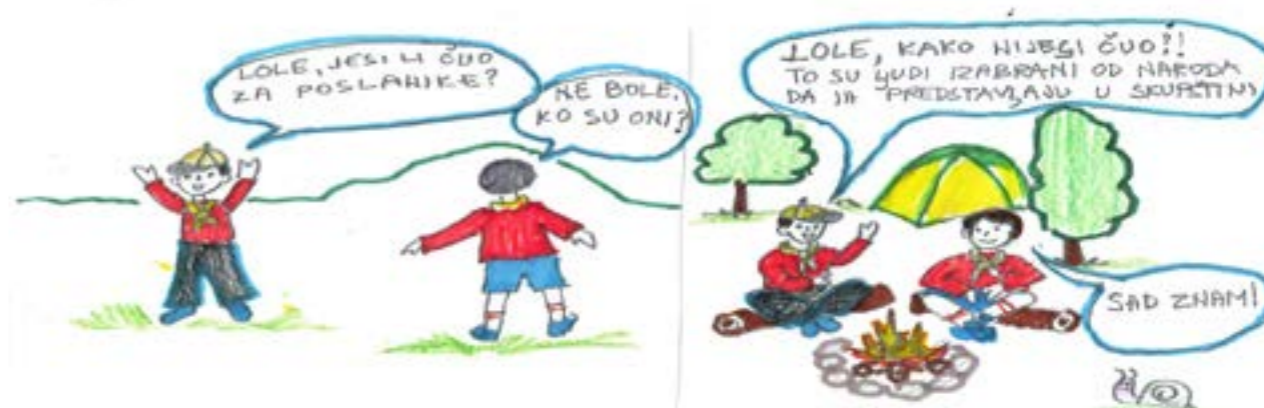
Kako bismo vas što više naučili, crtamo i još jedan strip. Na njemu smo prikazali izviđače (Loleta i Boleta) koji pričaju o poslanicima, koji rade u Skupštini. Autori: Simeun i redakcija