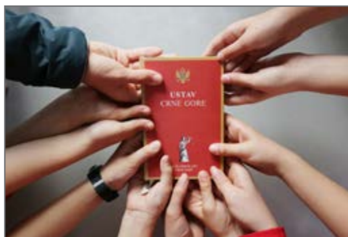
Ustav Crne Gore je najveći pravni akt. On je skup pravila i prava koja važe u našoj državi. U njemu je precizirano i biračko pravo.