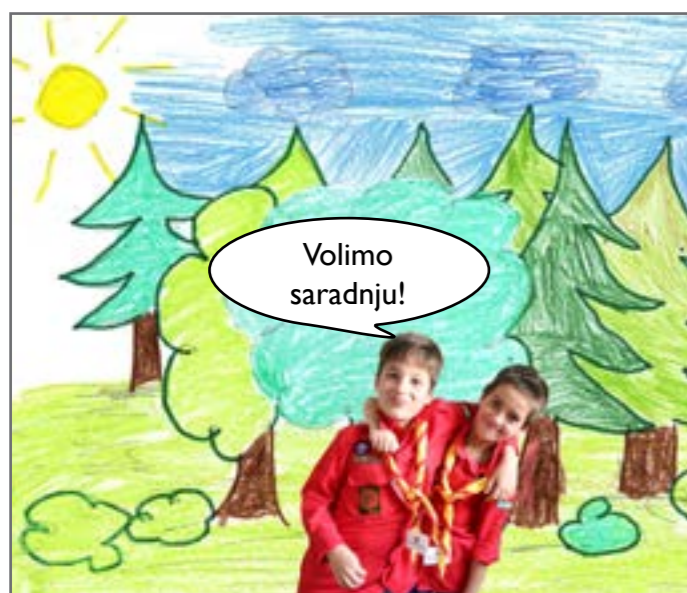
Sloga i drugarstvo su jako važne osobine, kako izviđača tako i poslanika i poslanica. Svi imamo zajedničku misiju - bolje društvo za sve.