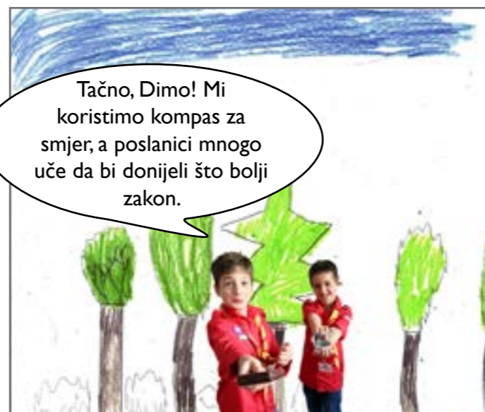
Red je došao i na Simeuna koji je objasnio svom drugaru da poslanici moraju biti informisani kako bi donijeli što bolji zakon u Skupštini.