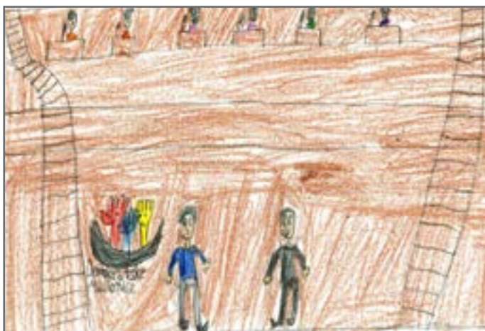
Aleksa je ilustrovaao situaciju kada se vode razgovori i predstavljaju ideje za koje birači treba da glasaju.