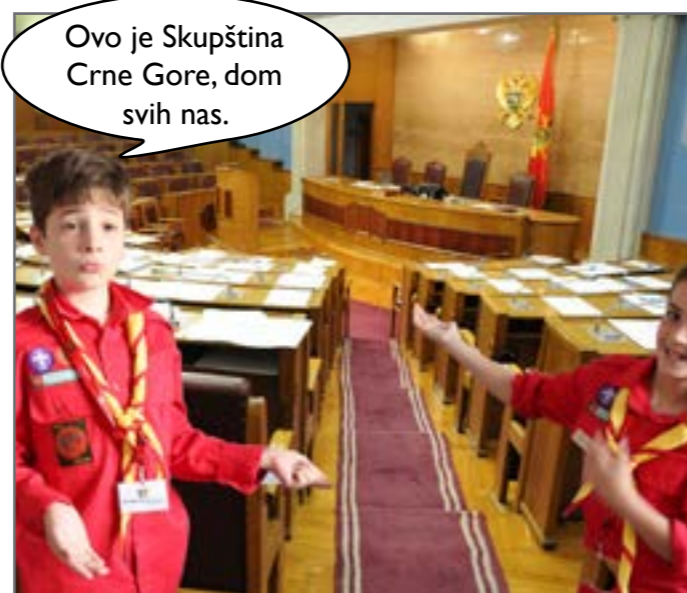
Drugari su na kraju posjetili Skupštinu Crne Gore u kojoj rade poslanici i poslanice i gdje marljivo rade na donošenju, mijenjaju i dopunjavanju zakona.

Mnogo puta ste žureći prešli ulicu, ali da li ste obratili pažnju na semafor? Znete li da je prelaz preko pješačkog prelaza tokom uključenog crvenog svijetla kršenje zakona? Ako to do sada niste znali, sada znate. Zakoni su pravila koja treba poštovati kako bi život u zajednici bio lakši i bolji za sve. Zakoni postoje sa razlogom. Oni nas štite (jer ako biste prešli pješački prelaz, koji smo pomenuli, mogao bi da naiđe automobil i da vas povrijedi, jer je vozaču na semaforu uključeno zeleno svijetlo). Ukoliko biste prekršili zakon, morali biste da platite kaznu koja je za to predviđena. Kazna služi da bi nas opametila da ne bismo kršili zakon.