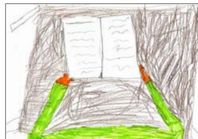
Glavni zadatak poslanika je da donose zakone, pravila u državi koja svi treba da poštuju, jer nas štite i organizuju nam život. Autor: Relja