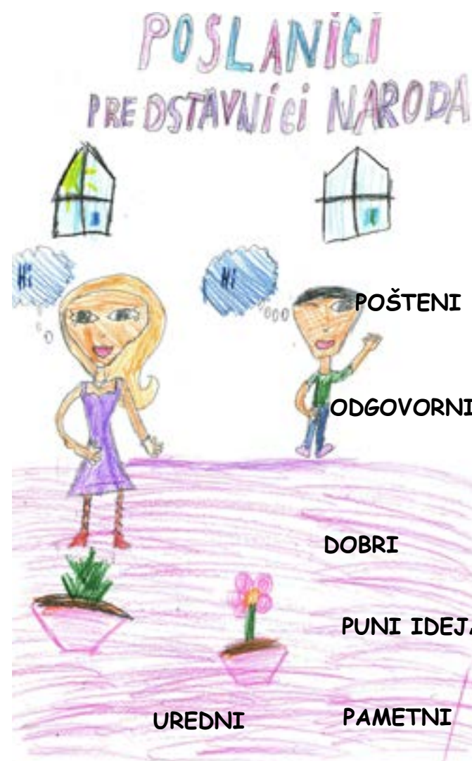
Anja nam je crtežom prikazala poslanicu i poslanika.