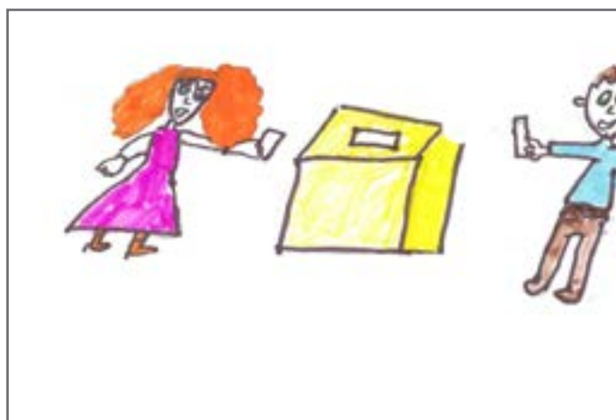
Lana je slikovito predstavila kako građani glasaju na izborima.