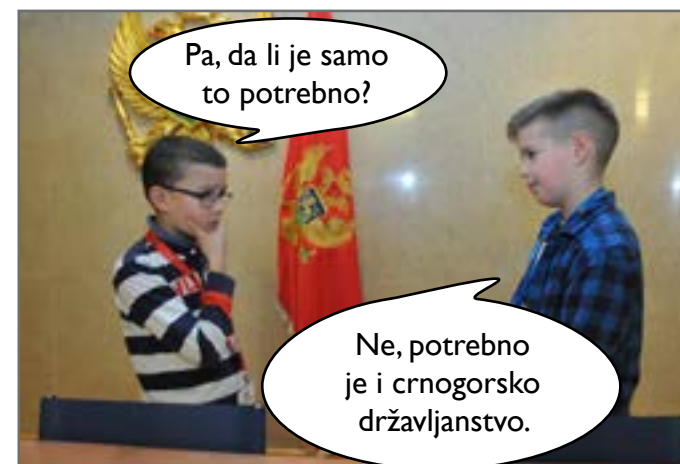
Pošto je naučio koji je prvi uslov, Vuk je željno iščekivao da sazna više o drugim uslovima potrebnim za glasanje.