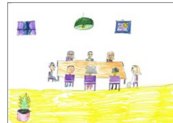
Zato se često sastaju i pričaju o tome kako urediti našu državu što bolje.