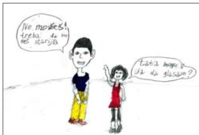
Elin je slikovito predstavila da mlađi od osamnaest godina ne mogu da glasaju na izborima.