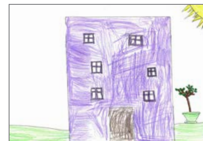
Oni rade i sastaju se u Skupštini Crne Gore, koju nam je crtežom prikazao Strahinja.