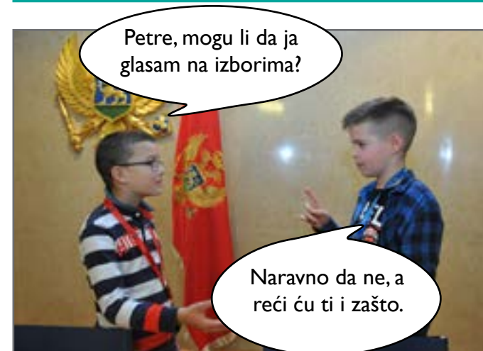
Vuk je bio zainteresovan za temu o kojoj je čuo na televiziji. Govorilo se o izborima.