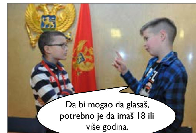
Petar je znao odgovor na pitanje, jer je ranije o tome čitao u knjizi građanskog vaspitanja.