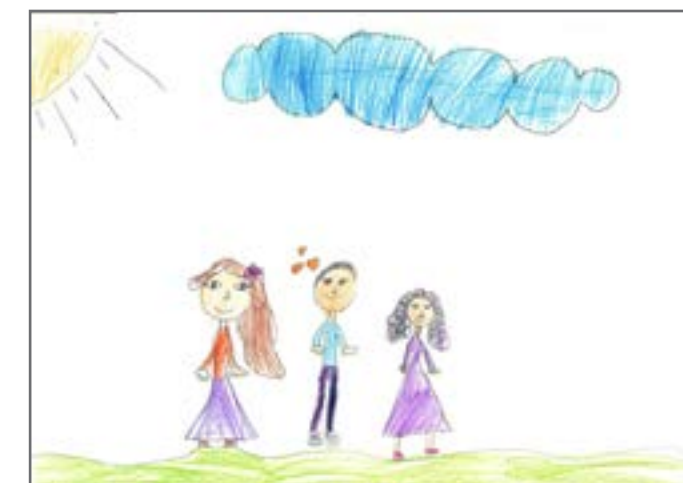
Poslanici probleme treba da rješavaju dijalogom i saradnjom. Autorka: Jelena